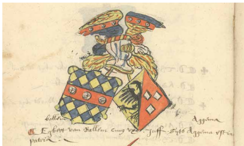
Het familiewapen van Egbert van Ballem (= Ballen, links) zoals dit voorkomt in het wapenboek Conscriptio exulum Frisiae (1580) fo. 89. Collectie Tresoar, Leeuwarden.

elders ingevoerde rogge. Toen de zusters een oude vrijstellingsbrief toonden, werd dit besluit herroepen. 23 Vermoedelijk stamde de vrijstellingsbrief uit de tijd dat de maagschap Ter Bruggen-Schelge-Jarges nog de toon aangaf in de Stad.