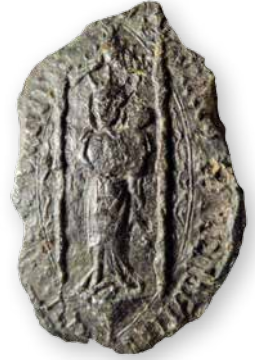
Het zegel van het convent Maria ten Hoorn, 1489. Te onderscheiden is Maria, staande met het kind Jezus op haar linkerarm en met een kroon op haar hoofd. Collectie RHC Groninger Archieven 1539-108.

Van verbouwingen of uitbreidingen na die tijd zijn geen schriftelijke stukken overgeleverd. Er is ongetwijfeld een kapel geweest, want de zusters ten Hoorn moesten vanaf 1475 ieder jaar een vigilie – een soort herdenkingsgebed – met negen psalmen bidden voor het zielenheil van een weldoener. De haardtegels wijzen op een verwarmd vertrek waarin of waarboven je ’s winters comfortabel kon zitten schrijven. 8 In 1571 is sprake van een priesterzaal en een