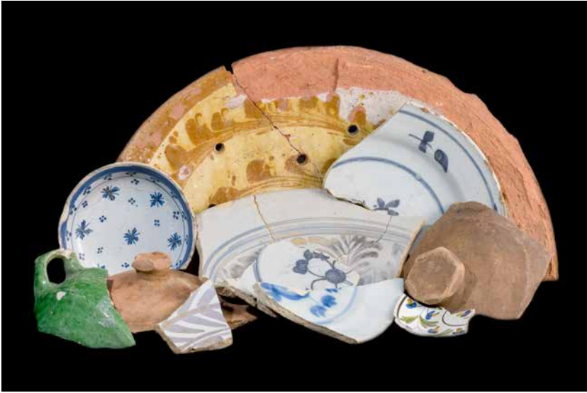
Scherven van laat- middeleeuws en 16 e -eeuws aardewerk, tijdens een veldverken- ning in 1977 aangetrof- fen op het voormalige kloosterterrein van het convent Maria ten Hoorn aan de Paterswoldseweg te Groningen. Collectie: Noordelijk Archeolo- gisch Depot (Nuis). Foto: Henk Faber Bultuis.

‘Gemene Leven’. In de stad Groningen kwam in 1439 zo’n fraterhuis tot stand aan het huidige Martinikerkhof. Het zusterhuis ten Hoorn werd hoe dan ook omstreeks 1550 omschreven als ‘ung pauvre cloistre de begines’ , en in 1555 was sprake van een weggelopen begijn ‘uuth den convente van den Hoorn’. Dat dit convent toen al was aangesloten bij het Utrechtse Kapittel, en dus bij de derde orde van Sint Franciscus, blijkt uit de deelname aan de ‘synode van Roomburg’ in dat laatste jaar. 15 In de hedendaagse vakliteratuur heten de zusters ten Hoorn daarom meestal tertiariissen, maar voor hun tijdgenoten waren ze eenvoudigweg begijnen.